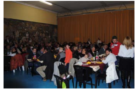
Alcune foto della serata

La serata è stata inoltre allietata dai “Mei che gnente”, un gruppo di musicisti locali che hanno suonato “brani e musiche di altri tempi” permettendo ai commensali, tra una portata e l'altra, di lanciarsi in qualche danza! Infine, un'attenzione particolare è stata dedicata ai più piccini: ognuno di loro si è aggiudicato un omaggio a ricordo della serata.