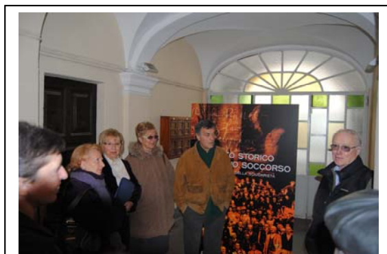
Ingresso del Museo

nell’Ottocento dall’Associazione generale degli operai di Pinerolo per svolgervi la propria attività sociale. In ogni sala il visitatore si troverà in compagnia dell’iconografia e della simbologia del mutualismo. E sarà la stretta di mano, il simbolo per eccellenza del mutuo soccorso, ad accompagnarlo nella lunga della via della solidarietà.